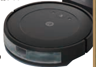
※画像はイメージです。※内容は予告なく変更となる場合があります。※当選された方には担当営業よりご連絡させていただきます。